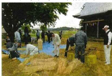
～伝承行事の準備作業～