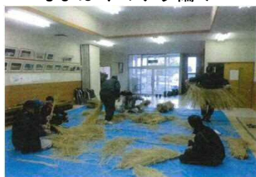
～なまはげのケラ編み～