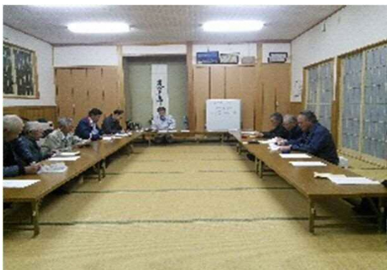
～集落協定の総会開催～