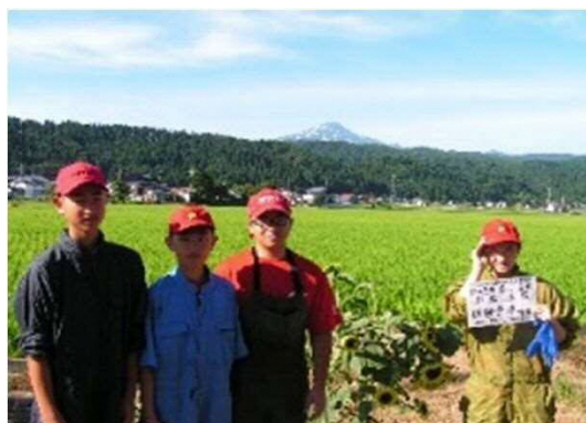
～中学生の農業体験学習～