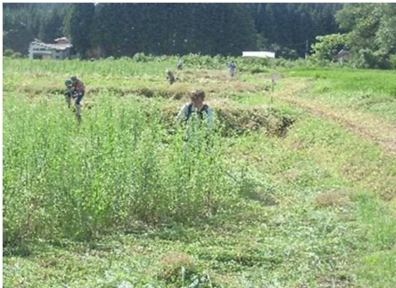
～農用地の共同草刈作業～