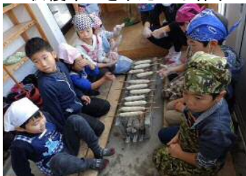
～収穫米できりたんぼ作り～