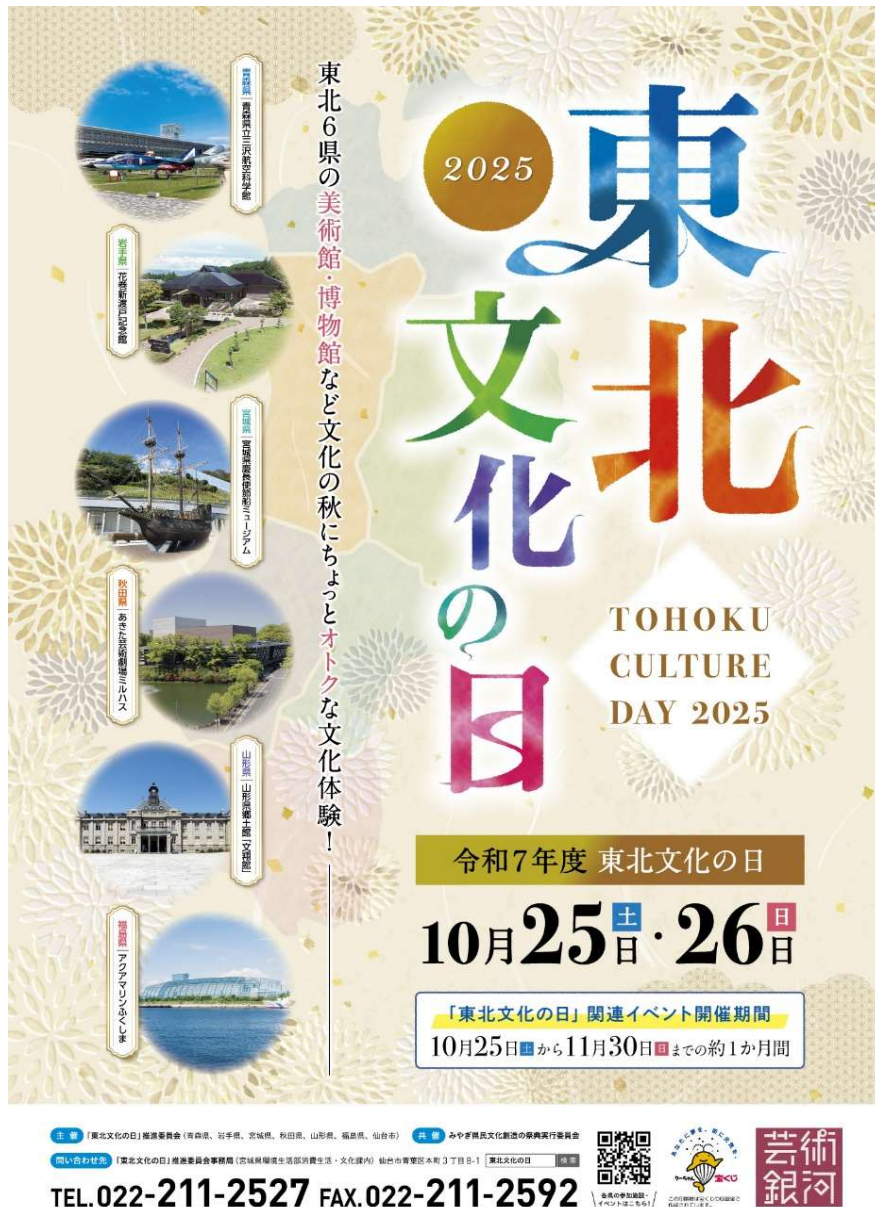
令和7年度ポスター

○「東北文化の日」ポータルサイト（8月公開予定）に、施設・イベント情報を掲載し、広報活動を行います。