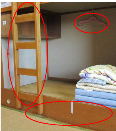
< 1階 >