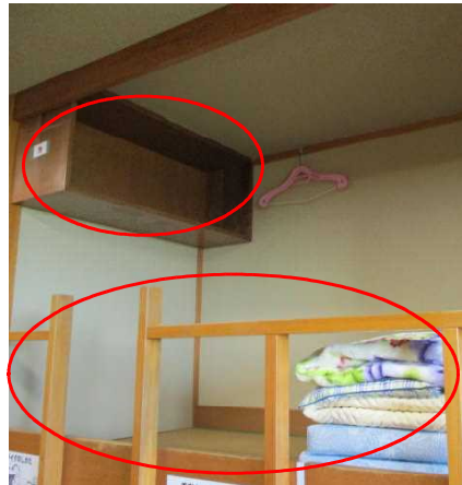
< 2階 >