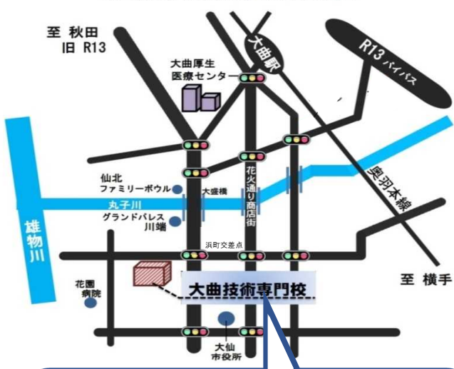
秋田県立大曲技術専門校の案内図