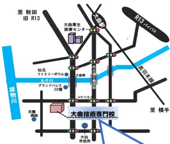
秋田県立大曲技術専門校の案内図