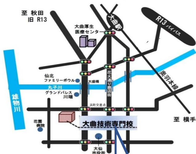
秋田県立大曲技術専門校の案内図