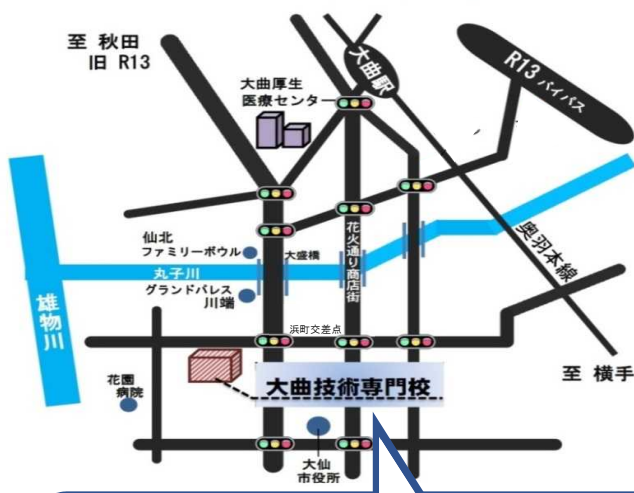
秋田県立大曲技術専門校の案内図