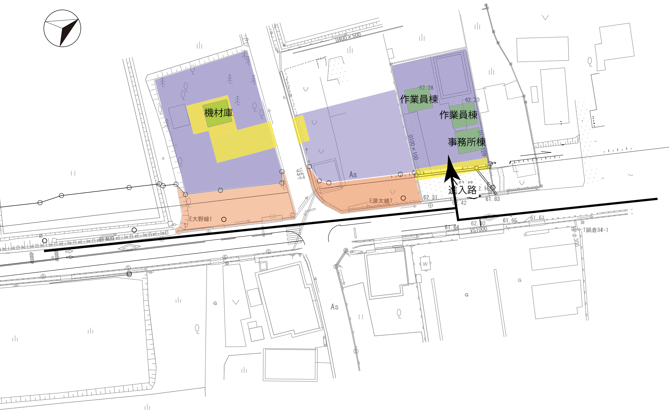
第2図 下都遺跡ヤード周辺図