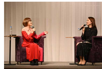
「読書の杜トークライブ」