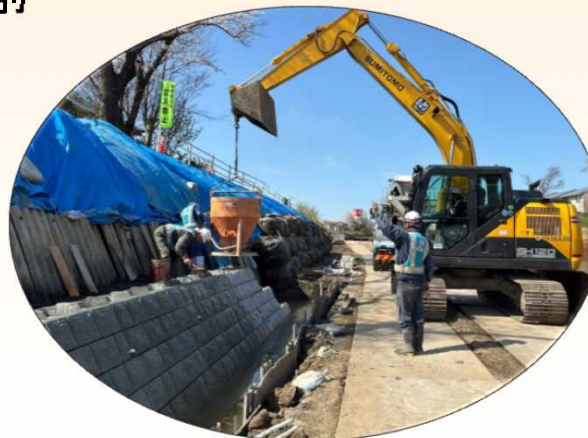
ごがん せこう 護岸施工