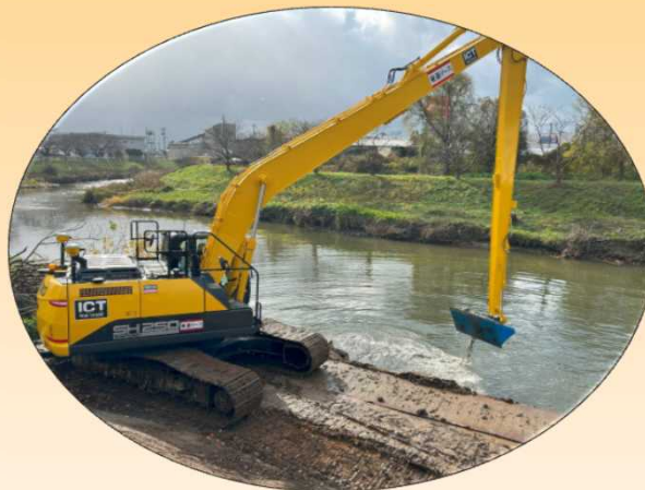
もりど くっさく 盛土・掘削