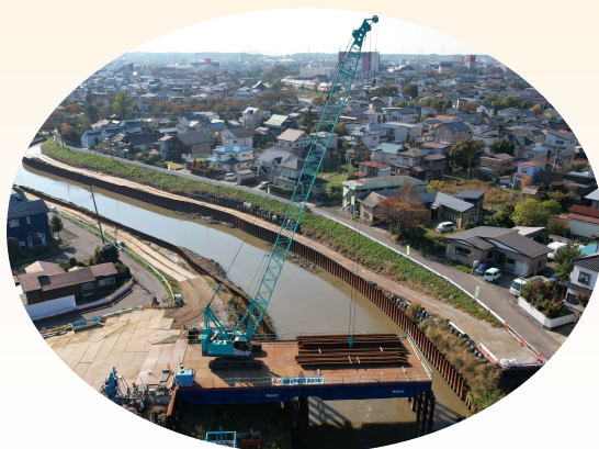
ざいりょう っ クレーンで材料を吊る