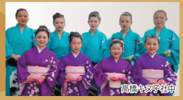
土崎港ばやし (土崎港ばやし保存会)