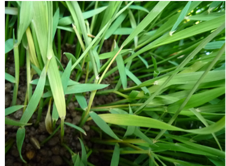
写真 もみ枯細菌病の発病

育苗箱の一部に凹部分が見られることで気がつくことが多い病害です。新葉基部と葉鞘部が白色～淡黄色に退色したり、新葉を引き抜くと簡単に抜ける等の症状が特徴です。