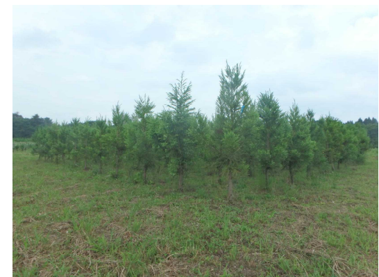
〔ミニチュア採種園〕