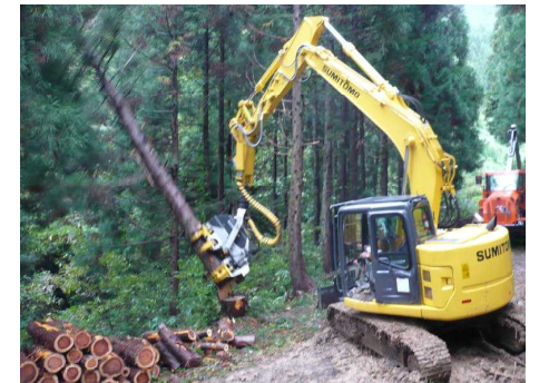
〔 高性能林業機械 (ハーベスタ) 〕