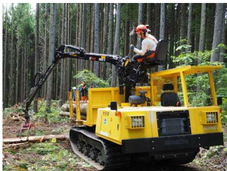
〔 高性能林業機械 (フォワーダ) 〕