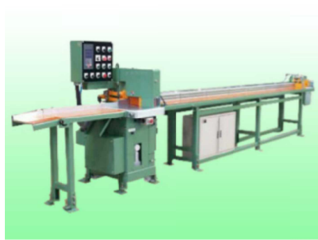
〔 木材加工施設 (クロスカットソー) 〕