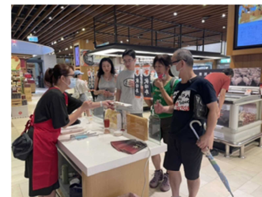
[量販店での試食販売会]

18,000千円 (国庫支出金 18,000千円) (負担金補助及び交付金 18,000千円)