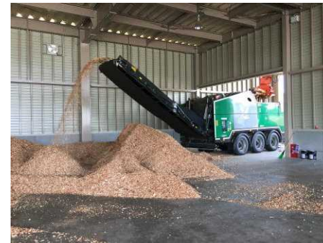
〔 バイオマス機械 (移動式チッパー) 〕