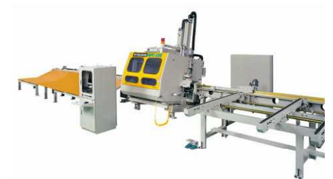
〔 木材加工施設 (羽柄加工機) 〕