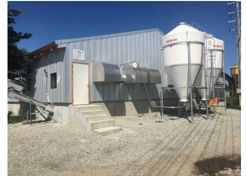
〔新設豚舎のイメージ〕