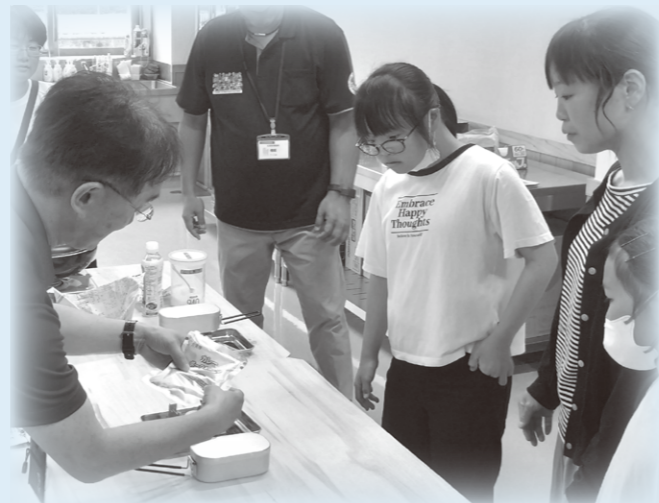
メスティンで「炊飯体験」 (八峰町)