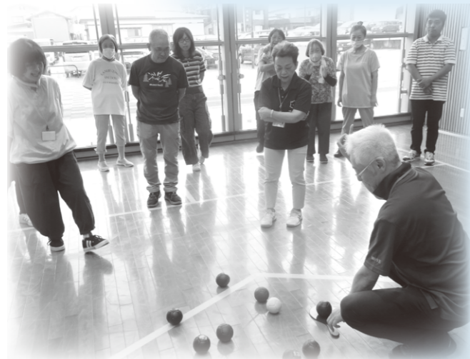
交流を楽しんだ「ボッチャ体験」 (北秋田市)

一步踏み出して学びの場をつくることで、参加者同士はもちろん、市町関係職員、秋田県生涯学習センター職員など、その場に集ったみんなの笑顔が繋がりました。