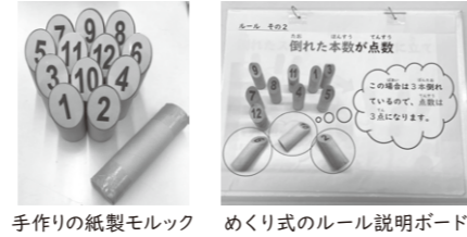
手作りの紙製モルック めくり式のルール説明ボード

ルールを参加者に合わせたり、室内でゲームができるように道具を工夫したりして、障害の有無にかかわらずモルックを楽しむことができるように研究を重ねました。モルックを通じて楽しく交流し、様々な場所で新たな人と人とのつながりが生まれました。