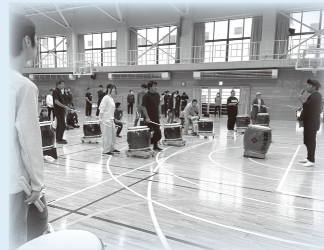
特別支援学校卒業生のニーズに沿った、 プロの太鼓演奏者による和太鼓体験教室

仙北市では、中央公民館がつなぎ役となり、特別支援学校、障害者支援施設、秋田県生涯学習センターと連携・協働しながら障害者の生涯学習を推進しています。令和4年度からスポーツ体験や防災教室、和太鼓体験教室等に継続して取り組み、障害の有無にかかわらず、つながりが年々深まっています。その中で、公民館職員と障害のある方々が「どんな学びをしたいのか」について話し合う機会を設けたことで、和太鼓の発表や歌唱教室（カラオケ）、料理教室等の新たな取組が企画され、様々な場所でみんなの笑顔が広がりました。