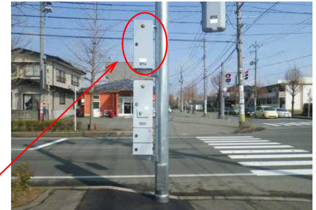
電池式信号機電源付加装置