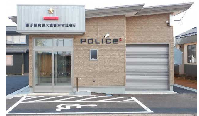
（改築イメージ） ※令和7年3月築（大雄駐在所）