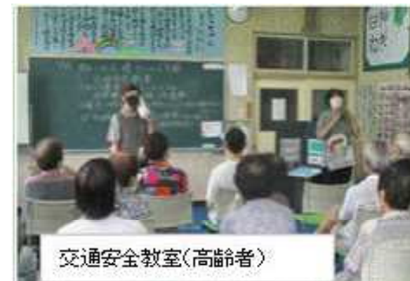
交通安全教室(高齢者)