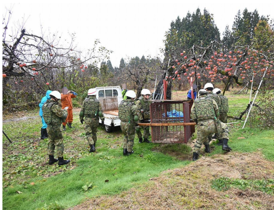
箱わな運搬(横手市)