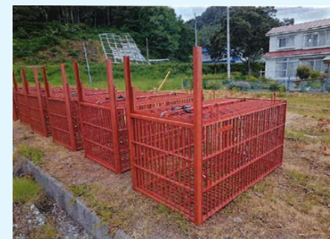
クマ捕獲用箱わな