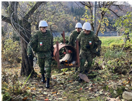
箱わな運搬(東成瀬村)