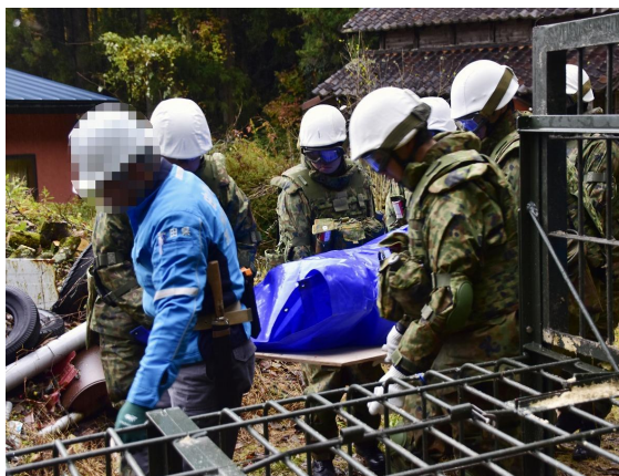
駆除後のクマ運搬(由利本荘市)