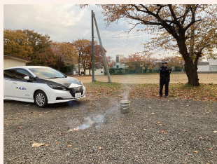
爆竹による忌避作業