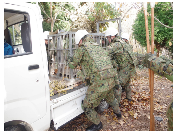
箱わな運搬(秋田市)