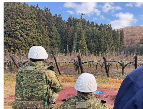
ドローンによる情報収集(鹿角市)