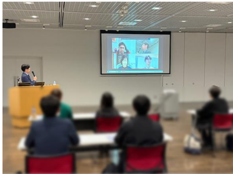
(在宅型勤務の従業員との交流の様子)

質疑応答では、参加者から「在宅型就労での質問の仕方の工夫は？」という質問があり、「定例ミーティング、チャット機能を使うなどの工夫をしている」という回答がありました。