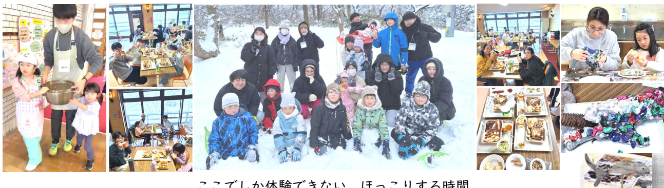
ここでしか体験できない、ほっこりする時間

今回のファミリーキャンプ（冬）は、手軽に楽しめる手作りランチや雪中スノーシュー体験、流木工作などにゆったりと向き合いながら、冬季のアウトドア体験を楽しむ中で家族の絆を深め、家族間での交流を図ることを目的に担当者が計画しました。