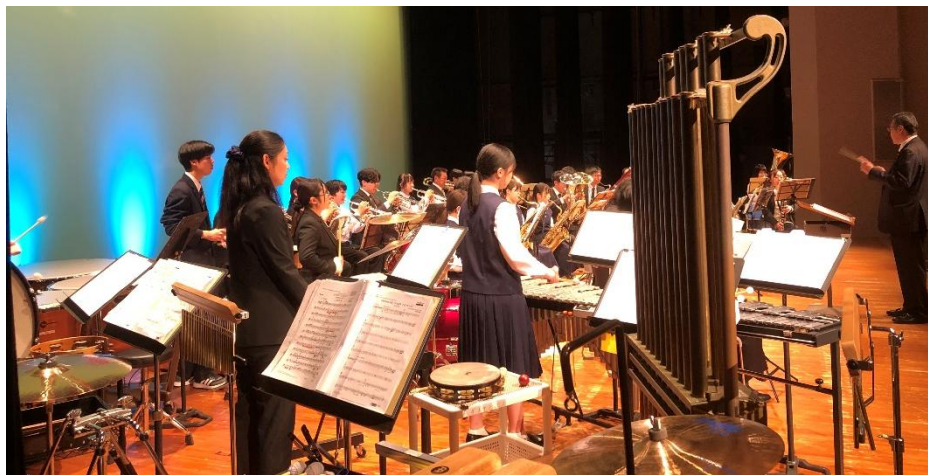
「史跡の里の秋まつり」での合同演奏