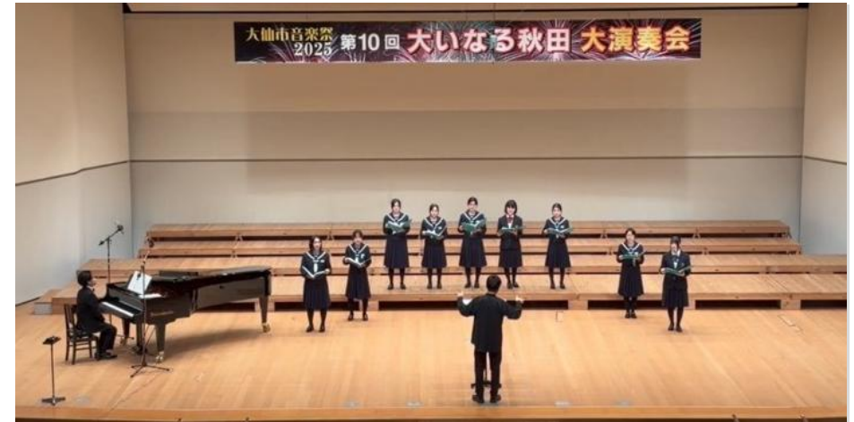
イベントに向けた高校生との合同練習