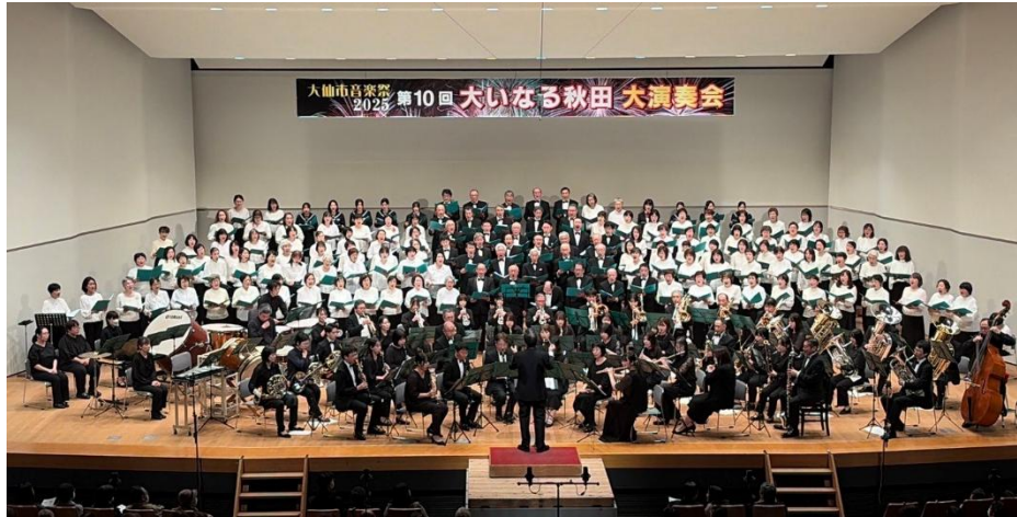
「大いなる秋田大演奏会」での合同合唱