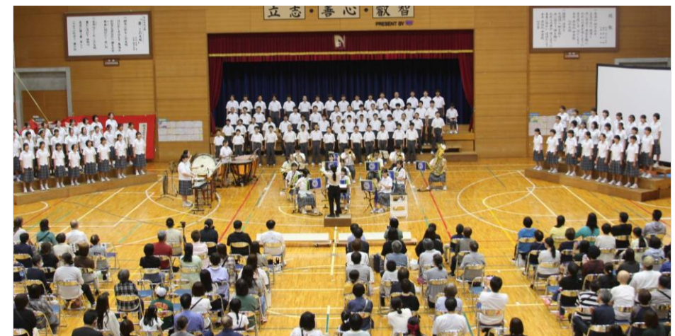
学校文化祭での合同演奏