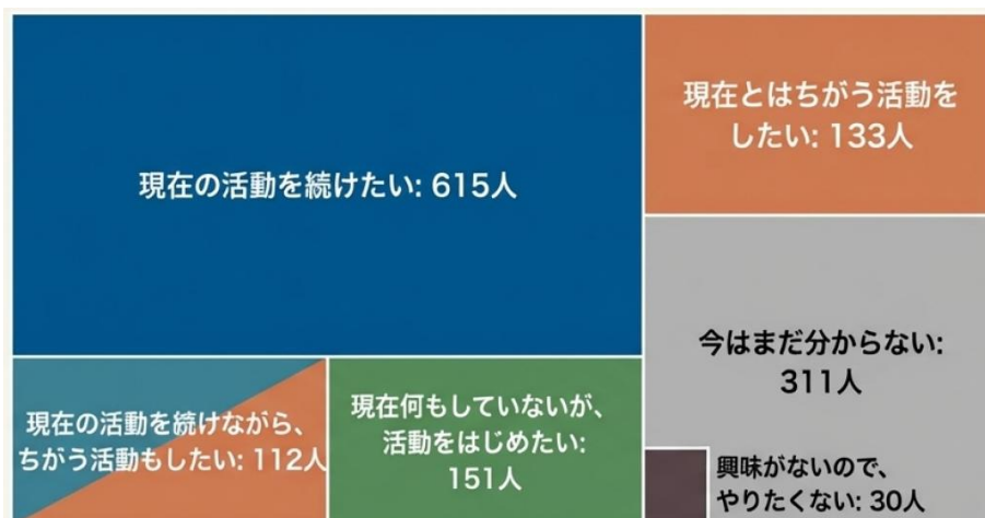
中学生になってからの活動意向