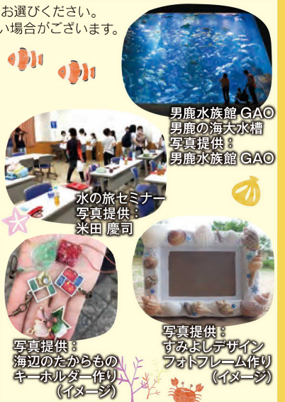
男鹿水族館 GAO 男鹿の海大水槽

ワークショップの制作体験は、お子様のみとなります。保護者の方につきましては、材料のご用意はございませんので、お子様の体験をサポートしていただきますようお願いいたします。