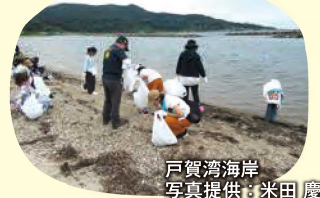
戸賀湾海岸