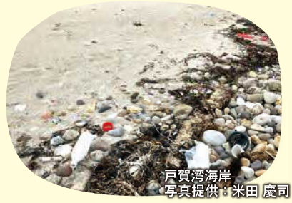
戸賀湾海岸

海岸で見られる海そうや貝などの自然物のほか、ペットボトルやガラス、プラスチック容器など海洋ごみといわれるものについて触れ、「海のごみはどこから来るのか？」などのお話を聞いてもらいます。