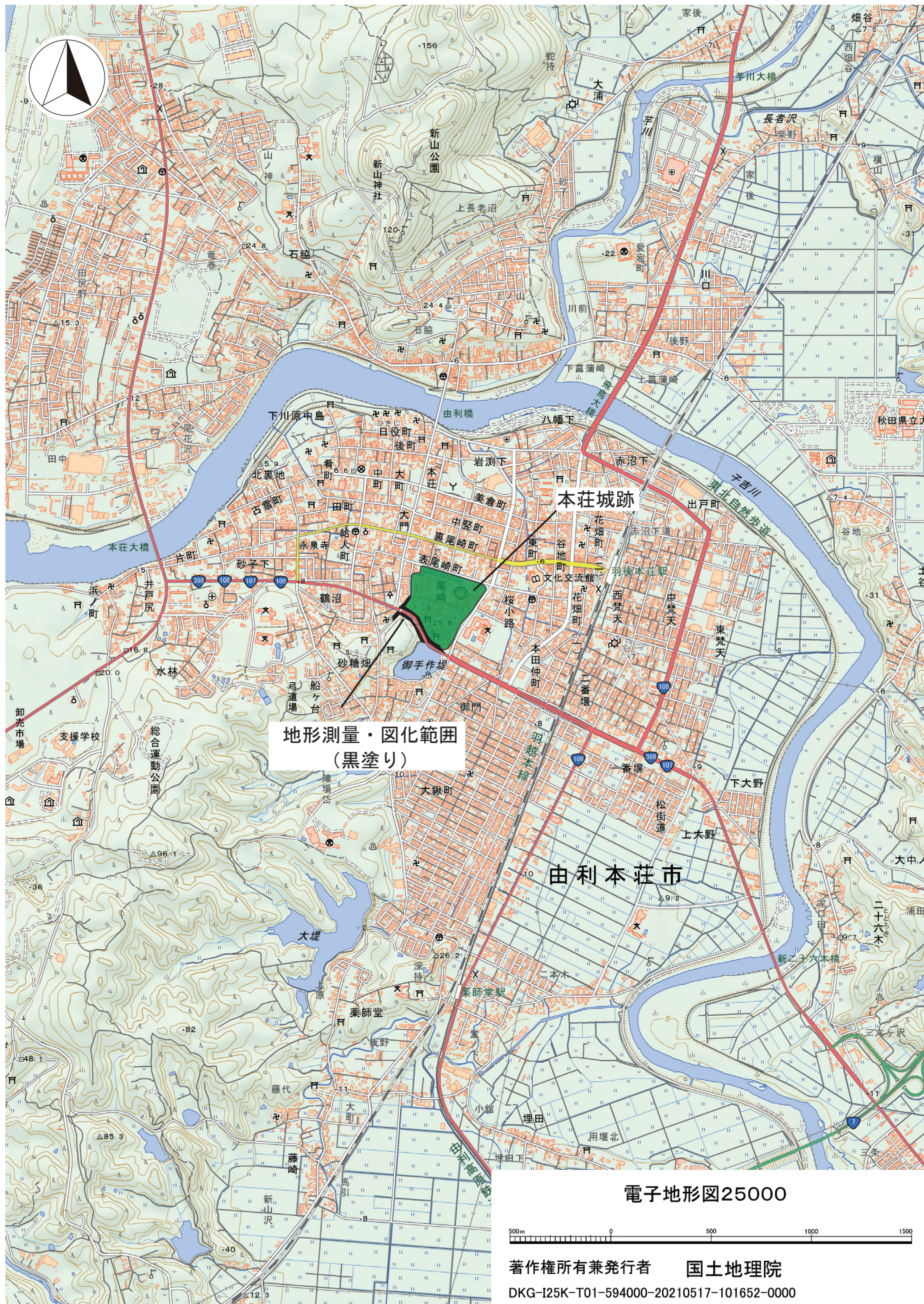
第1図 本荘城跡位置図