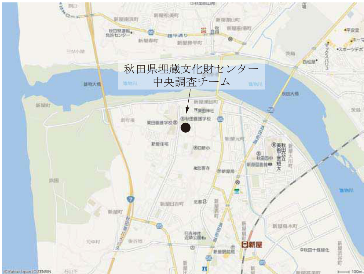
第2図 秋田県埋蔵文化財センター中央調査チーム周辺詳細図