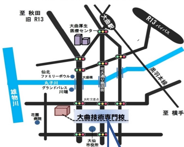
秋田県立大曲技術専門校の案内図