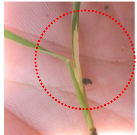
写真 もみ枯細菌病発病苗

近年、もみ枯細菌病の発生が増加しています。本病は新葉基部と葉鞘部が白色～淡黄色となり、次第に腐敗枯死します。発病苗の新葉を引き抜くと基部から容易に抜けます。発病後の薬剤による防除方法はありません。育苗期間中の高温と過剰かん水に注意し、発病苗を確認した場合は直ちに箱ごと設置床から外し、移植に用いないでください。