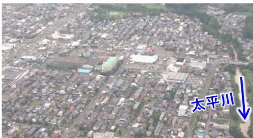
令和5年7月の大雨（秋田県秋田市）