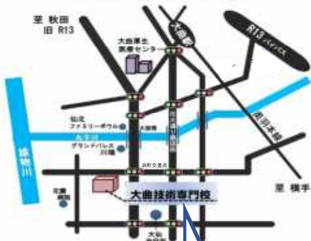
秋田県立大曲技術専門校の案内図