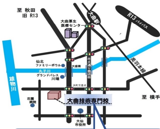
秋田県立大曲技術専門校の案内図