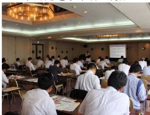
(メンテナンス事業者育成研修)