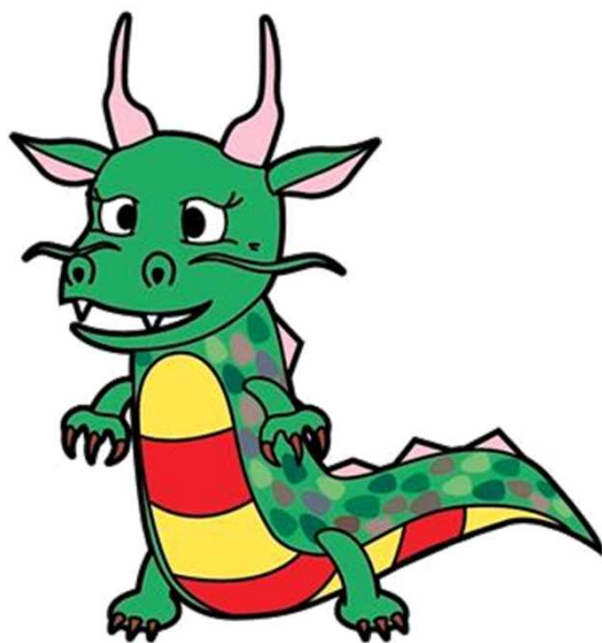
八郎湖水質保全シンボルキャラクター 「清龍(せいりゅう)くん」