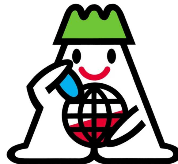
地球温暖化防止マスコットキャラクター 「あすぴー」