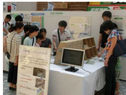
廃棄物の減量化・リサイクルに関する普及啓発事業 (左:あきたエコフェス、右:食品ロス削減推進イベント)