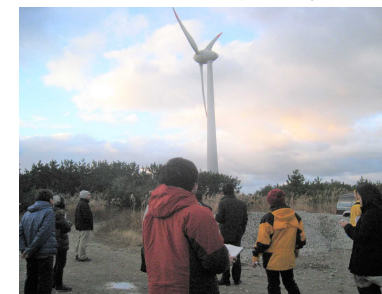
環境アセスメントに係る有識者による現地確認