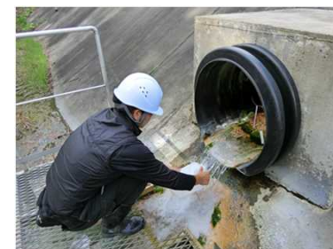
廃棄物処理施設への立入検査