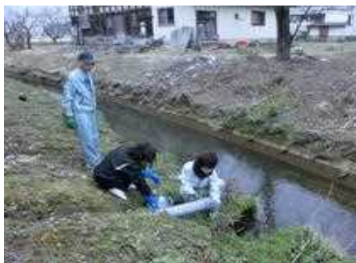
事業場での排出水の採取