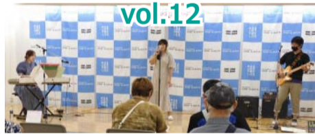
アンリミテッドカラー UNLIMITED COLOR