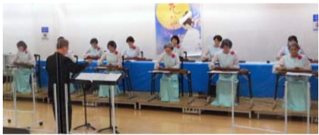
大正琴・文化箏「花かげ会」