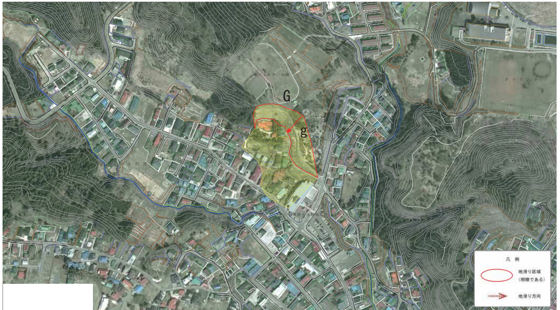
様式-2(地) 土砂災害警戒区域 区域図