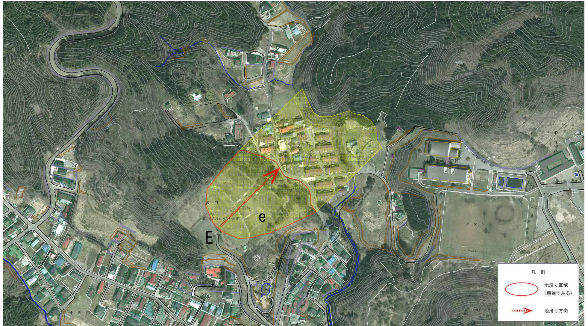
様式-2(地) 土砂災害警戒区域 区域図