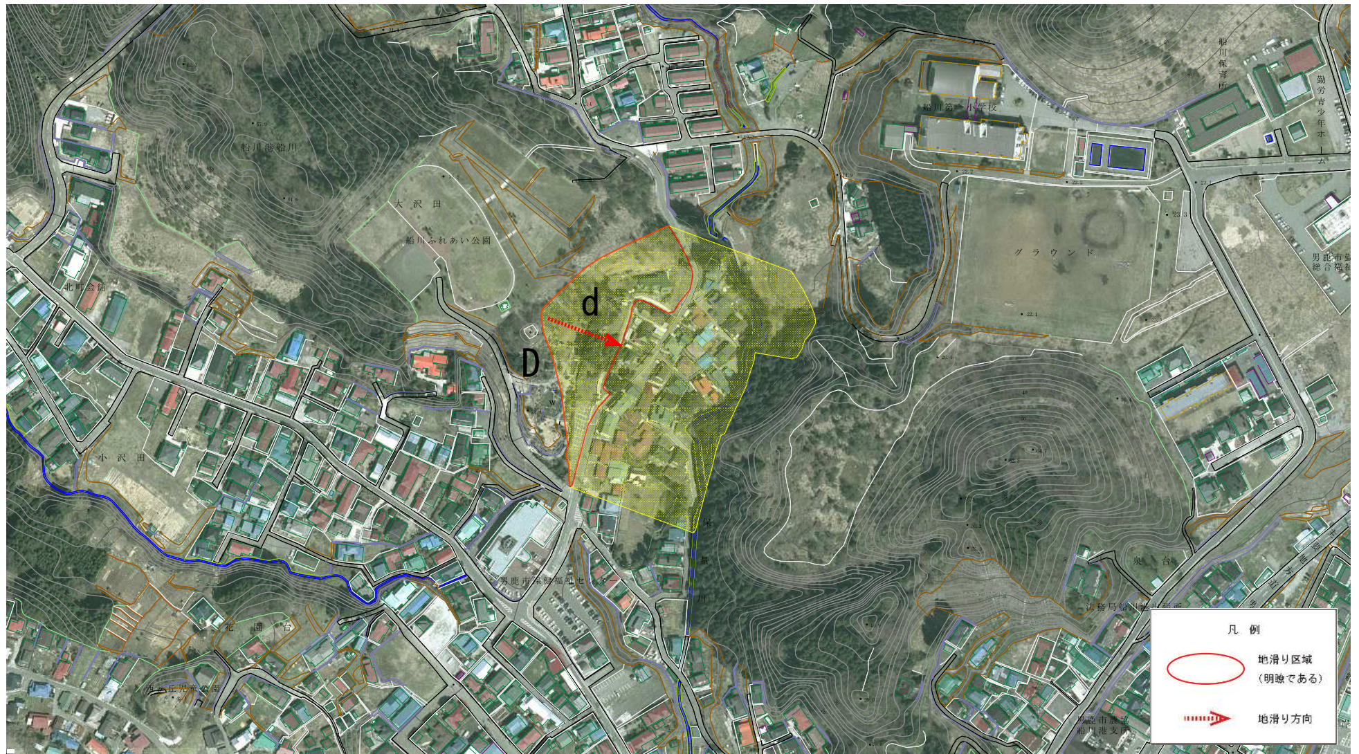
様式-2(地) 土砂災害警戒区域 区域図