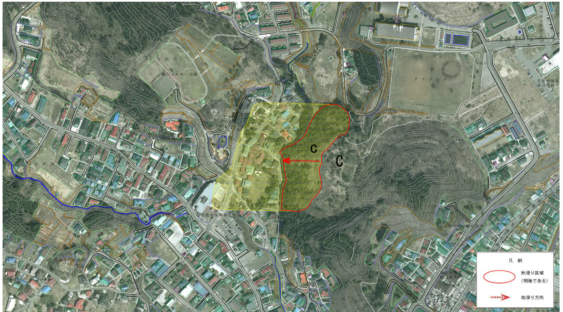
様式-2(地) 土砂災害警戒区域 区域図