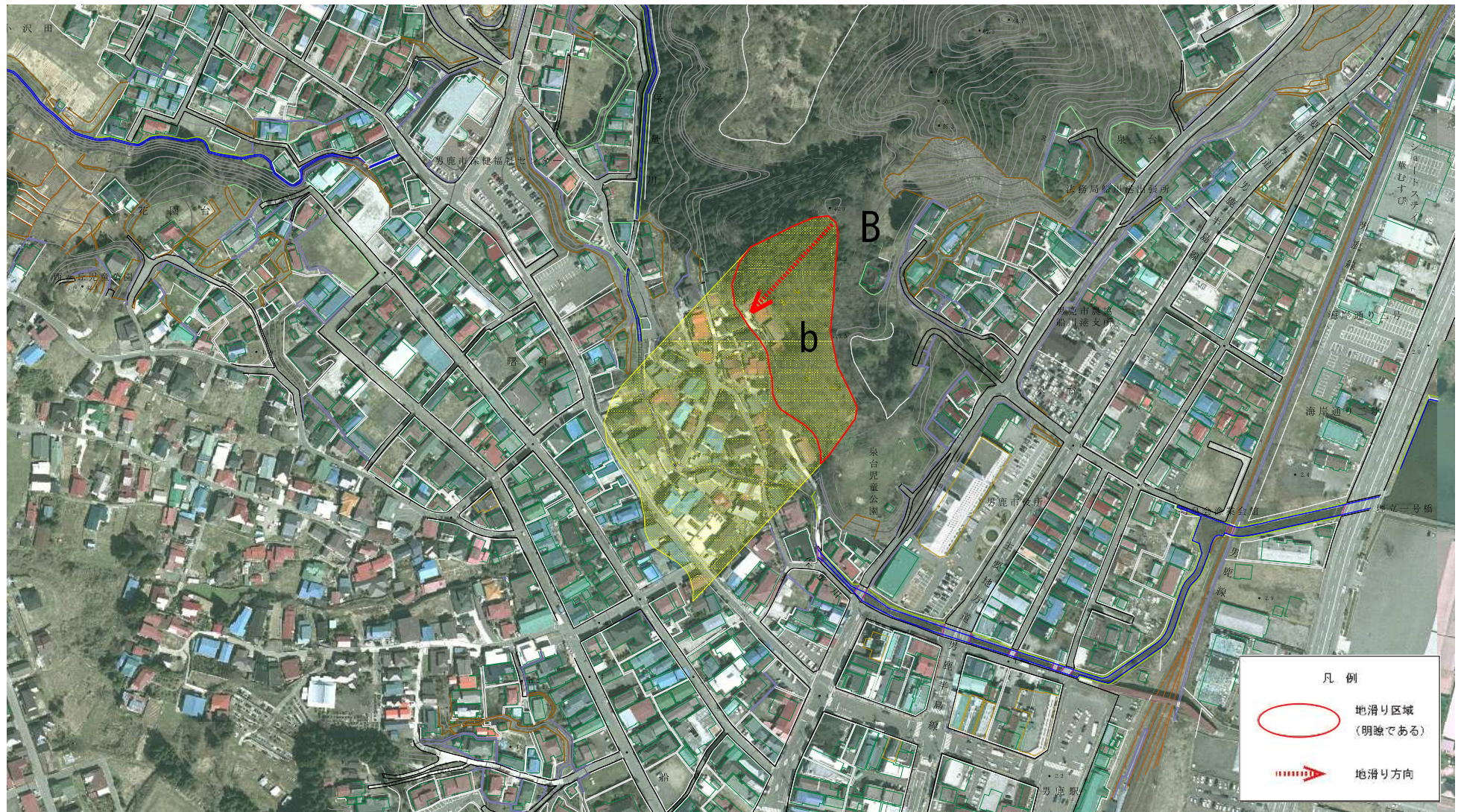
様式-2(地) 土砂災害警戒区域 区域図