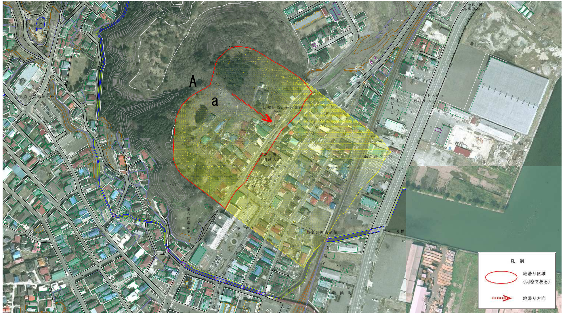
様式-2(地) 土砂災害警戒区域 区域図