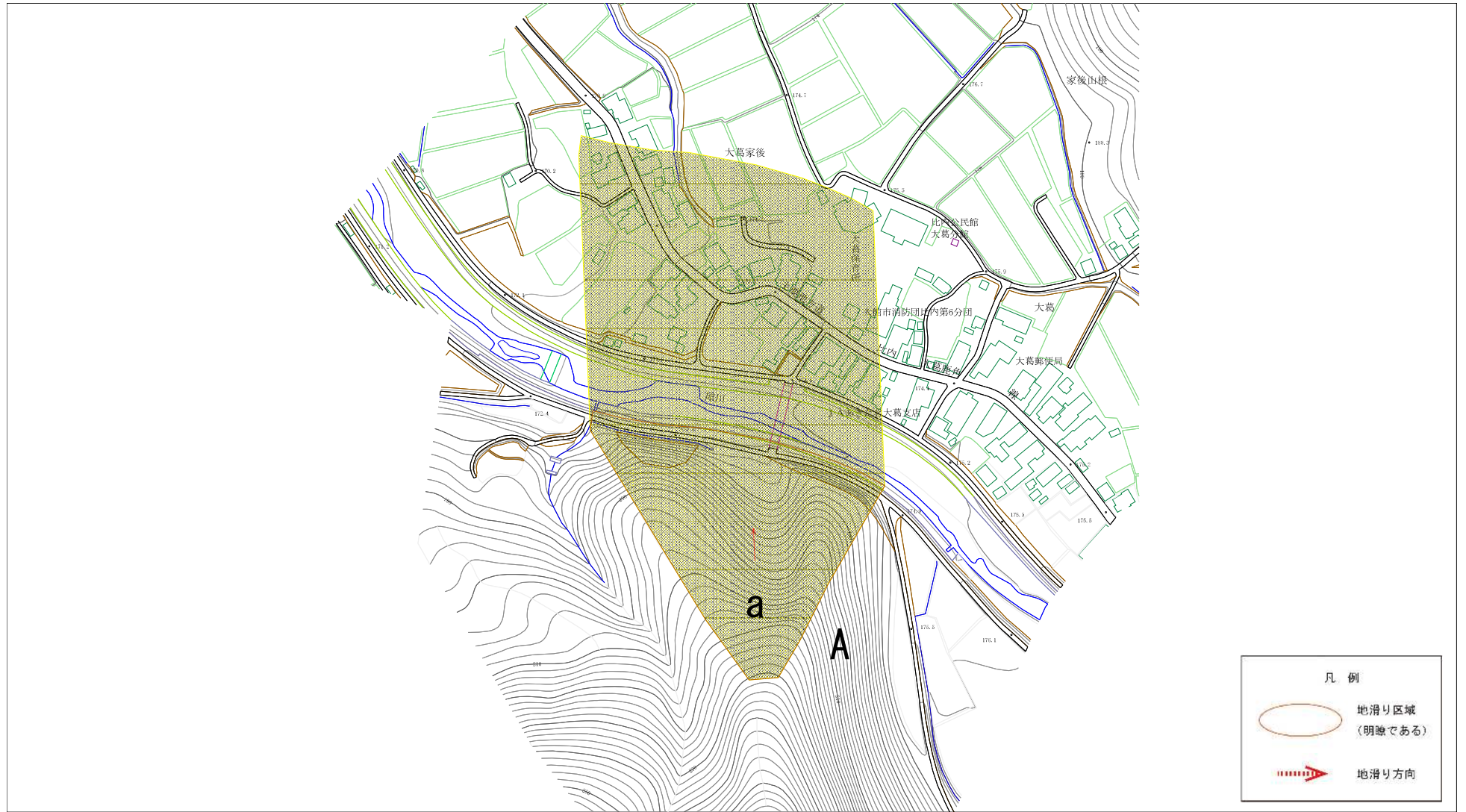
様式-2(地) 土砂災害警戒区域 区域図