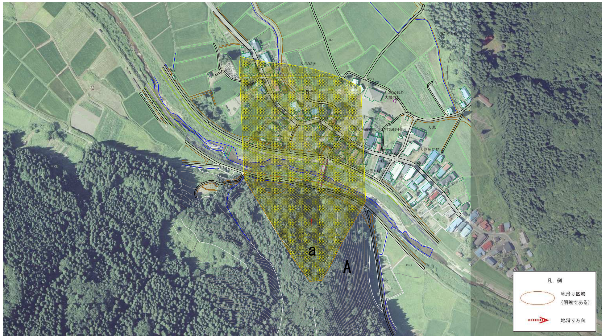
様式-2(地) 土砂災害警戒区域 区域図