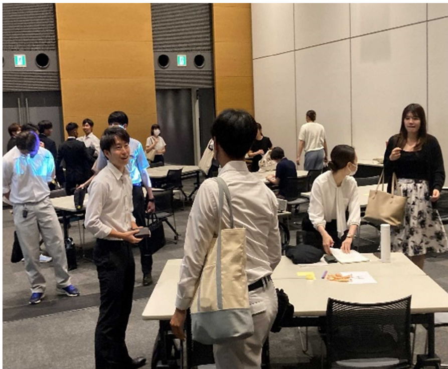
(終了後、会場に残って名刺交換など交流をする参加者)

また、この交流会では若者がどんな職場で働きたいと思っているのかなどについてアンケートを行いました。今回の研修会&交流会から得られた“働きやすい職場づくり”に関する若手社員の意見等は、企業の経営者や人事総務の方々が参加している実践講座において、今後フィードバックしてまいります。