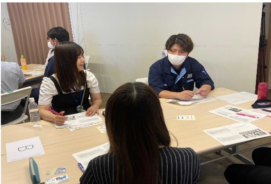
(意見交換をする様子 (県南エリア))