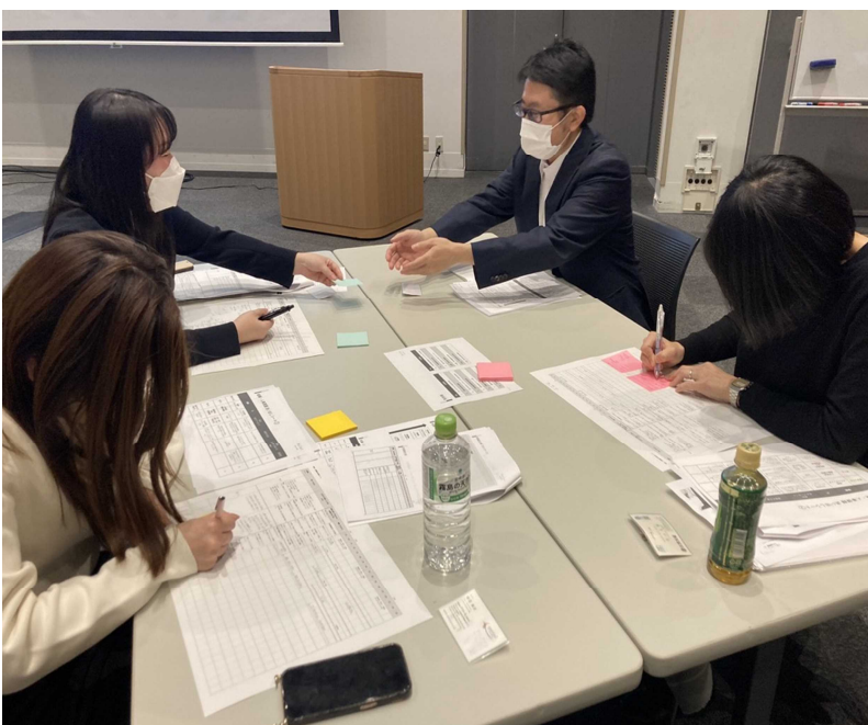
(グループ対話の様子)