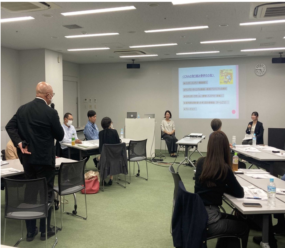
(参加者による質問の様子)