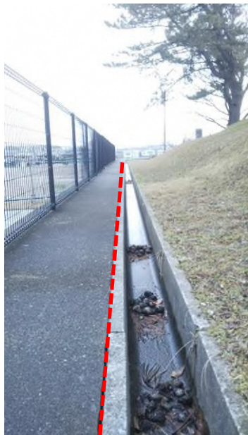
⑦第4駐車場の天端・側溝（東側）