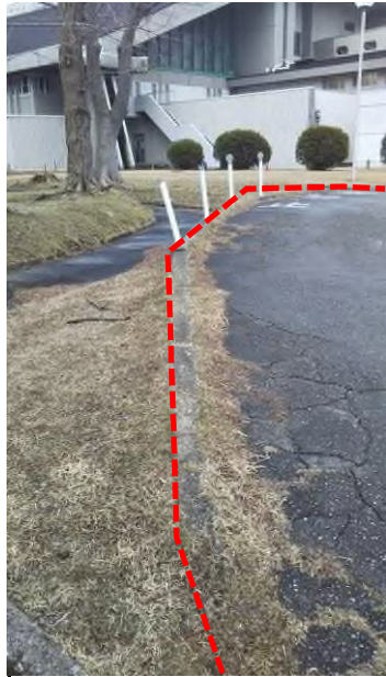
②西側出入口の通路