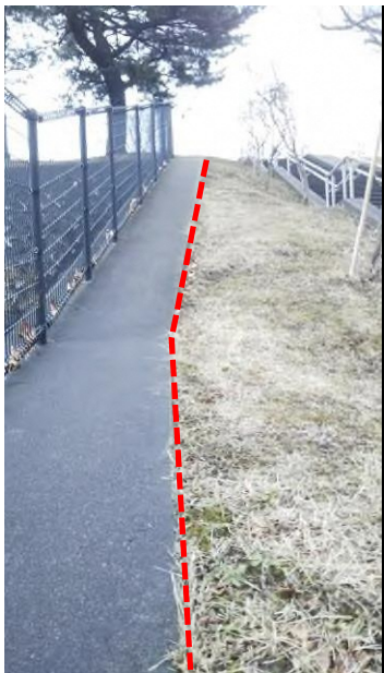
⑥第4駐車場の天端（南側）