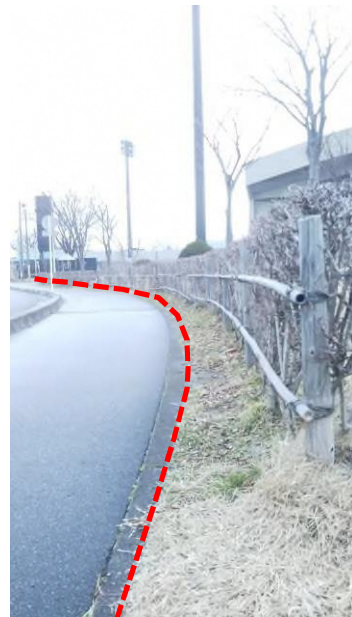
⑨市道八橋本町31号線の地先境界ブロック