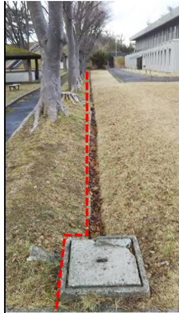
③福祉公園との境界