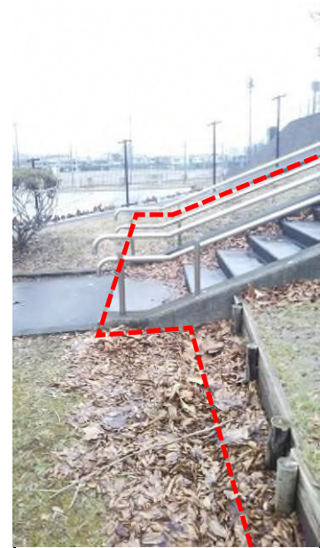
⑤丘への階段の登口