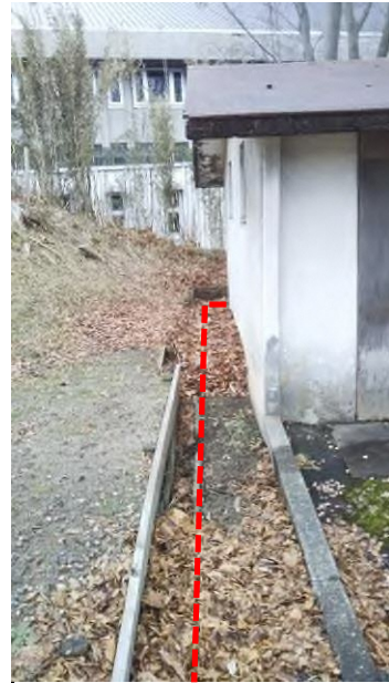
④福祉公園内トイレの裏