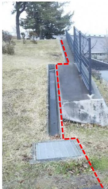
⑧第4駐車場天端・側溝