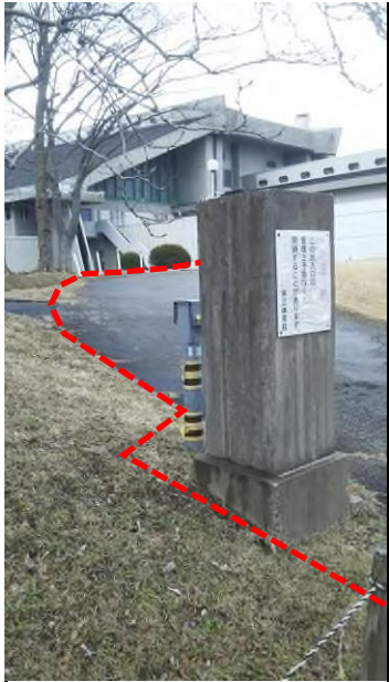
①西側出入口の門柱