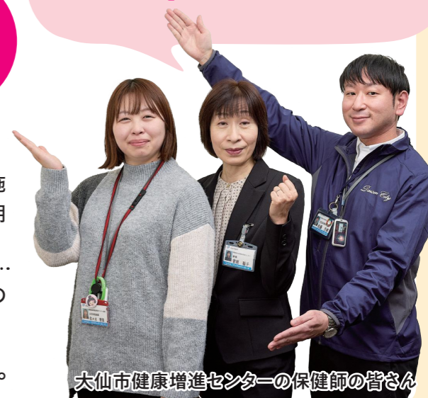
大仙市健康増進センターの保健師の皆さん

健(検)診の受診は、自分の体の状態を知ること、守ること。大切なのは「自分の健康は自分で守る」という意識です。