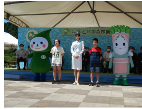
2022あきた水と緑の森林祭典風景(能代市)