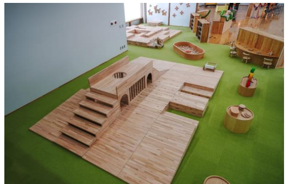
【大館市】大館樹海ドームパーク内 木育資材導入