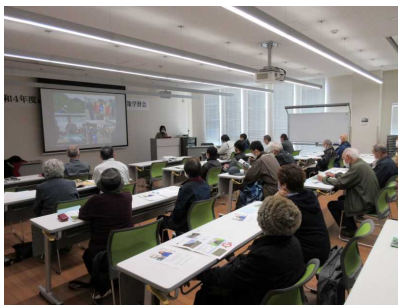
クマ対策学習会(北秋田市) (向黒沢自治会)