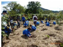
植樹活動(鹿角市) (鹿角市河川漁業協同組合)