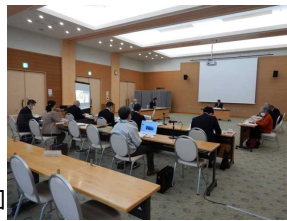
水と緑の森づくり基金運営委員会