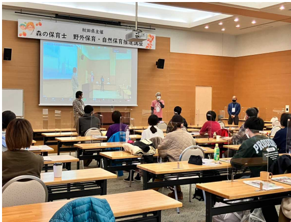
講座風景(ブラザクリプトン)