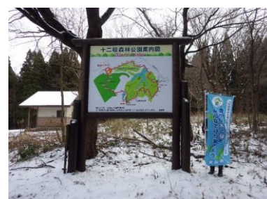
【男鹿市】十二桜森林公園 標識類整備(案内板)、休憩施設整備(東屋・ベンチ)