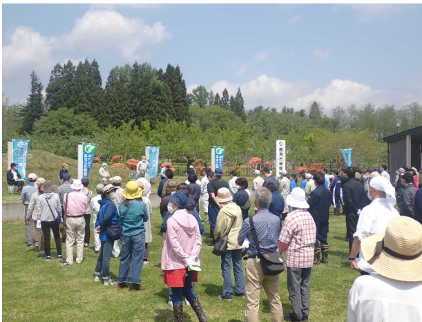
地域住民を対象とした植樹活動 (鹿角市)