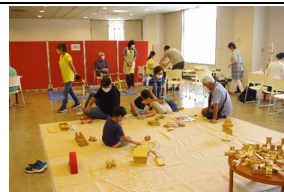
木育イベント(北秋田市) (アミュージングサポートあそそ☆ぶ)