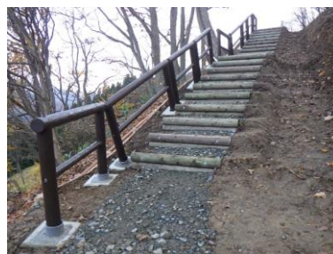
【湯沢市】とことん山 利便性向上施設整備(ウッドデッキ)、安全防護施設整備(安全防護柵)、路網整備(遊歩道整備)