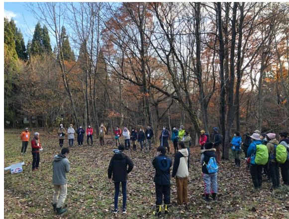
自然観察会(ブラザクリプトン周辺)