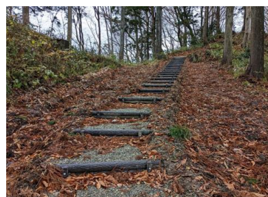
【大仙市】杉山田月山公園 休憩施設整備(東屋・ベンチ)、路網整備(歩道開設)