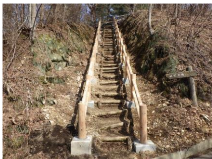
【小坂町】町民憩いの森 安全防護施設整備(安全防護柵)