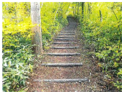
【大仙市】太田交流の森 路網整備(歩道補修)