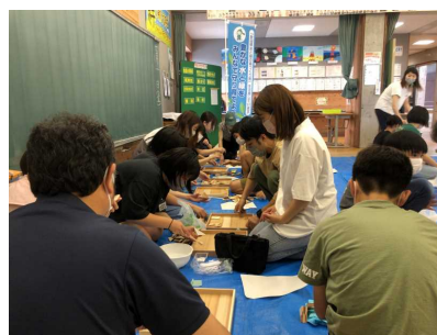
木育活動(北秋田市) (扇田小学校PTA)