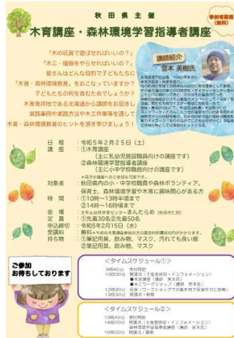
講座案内パンフレット