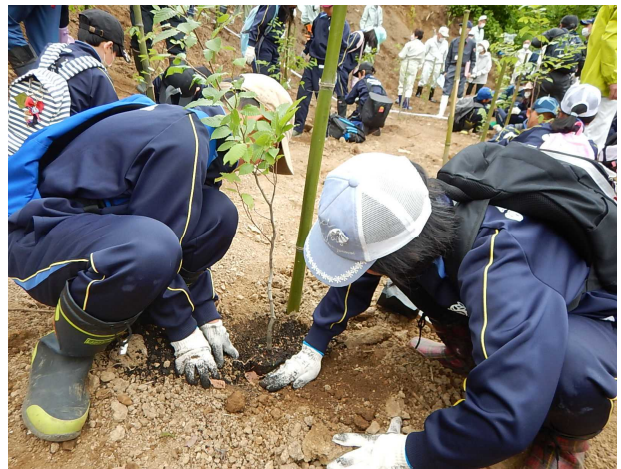
小学生を対象とした植樹活動 (美郷町)