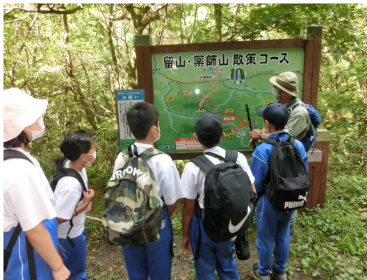
自然観察会(川口小)