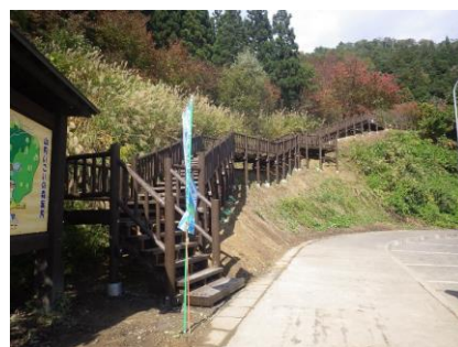
【横手市】山内こいの森 路網整備(遊歩道・階段)