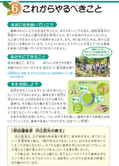
副読本「あきたの森林」