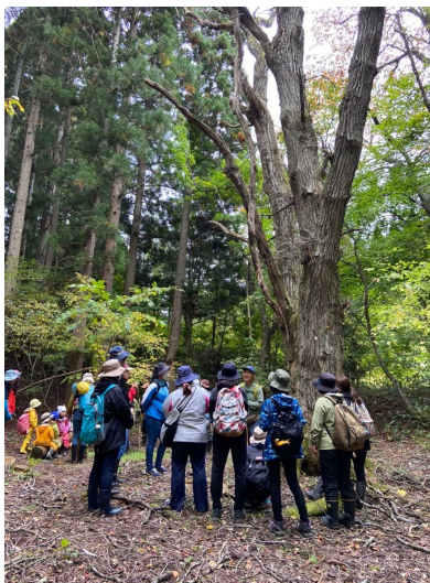
子供と一緒に参加した自然体験(男鹿市の森林)