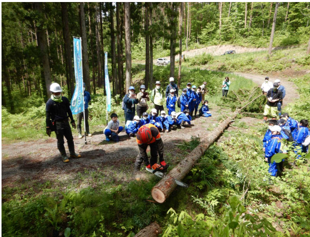
小学生を対象とした森の教室 (湯沢市)