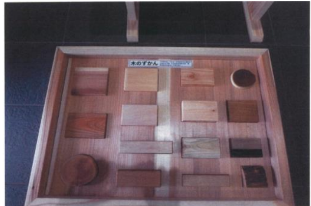
【湯沢市】JR湯沢駅構内 木育資材導入