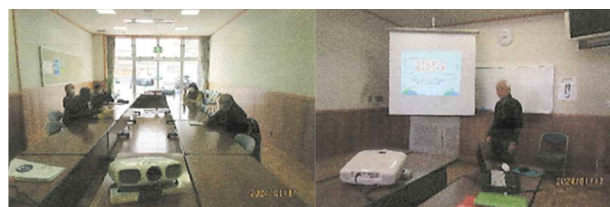
大館・鹿角地区での実施の様子 (令和6年1月17日)