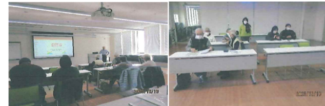
北秋田地区での実施の様子 (令和5年12月19日)