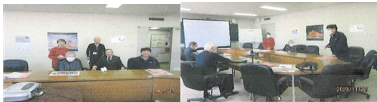
能代・山本地区での様子 (令和5年11月22日)

今回の学習会が、それぞれが地球温暖化を自分事として捉えて、普段の暮らしの中で出来ることから行動するきっかけとなることが期待されます。