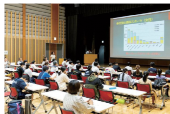
▲医師による講演会