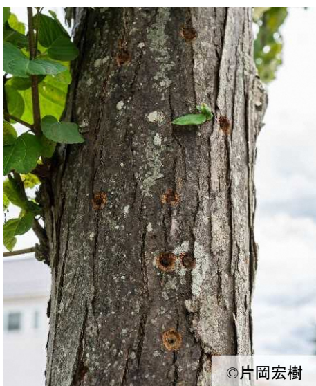
ツヤハダゴマダラカミキリの産卵痕

国内にはゴマダラカミキリ等、同属の在来種4種が分布している。各種とも類似するが、上翅のつけ根の細かい突起の有無等の特徴から識別できる。