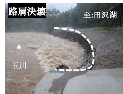
国道341号 玉川地内(仙北市)