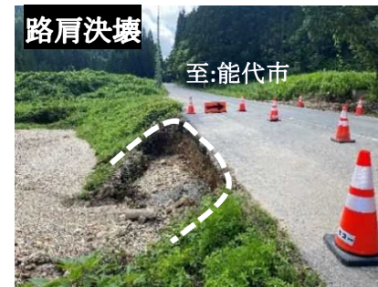
(主) 能代五城目線 浅見内地内(五城目町)