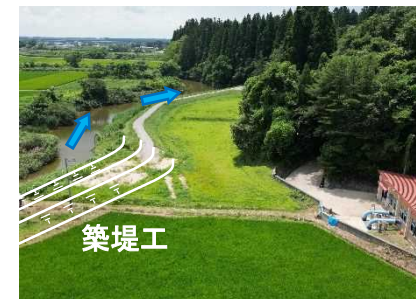
三種川（三種町森岳）