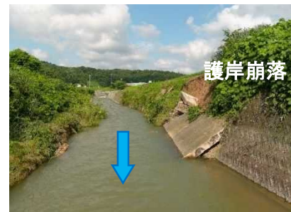
君ヶ野川（由利本荘市岩城道川）