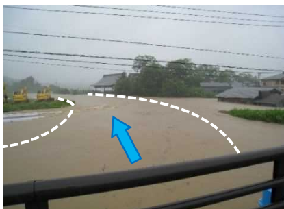
三種川（三種町下岩川）