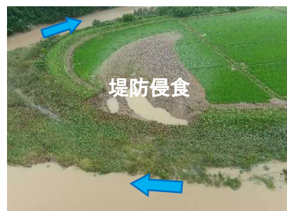
小阿仁川（北秋田市鎌沢）