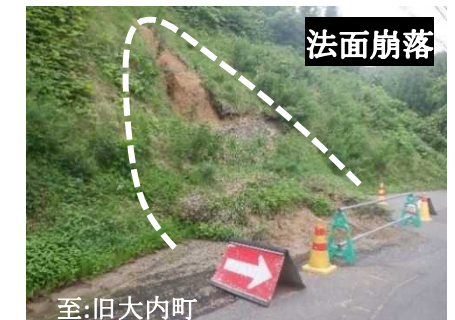
(一) 檜渕横渡線 滝地内(由利本荘市)