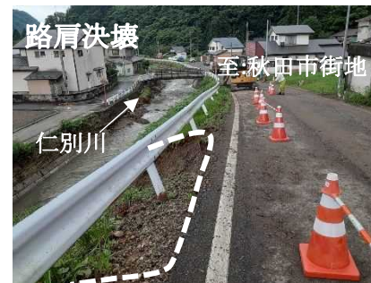
(主) 秋田八郎湯線 仁別家ハヅレ地内(秋田市)