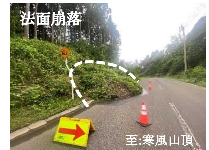
(主) 入道崎寒風山線 菅ノ沢地内(男鹿市)