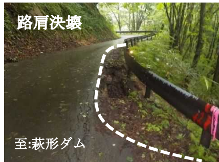
(一) 杉沢小阿仁線 番鳥地内(上小阿仁村)