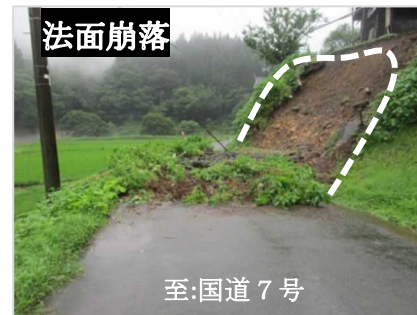
(一) 小滝二ツ井線 梅内大畑地内(能代市)