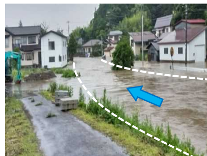
馬踏川（秋田市金足堀内）