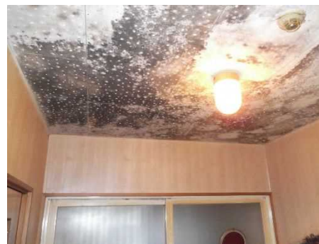
浴室 カビ取り 天井パネル貼り替え 壁パネル貼り替え