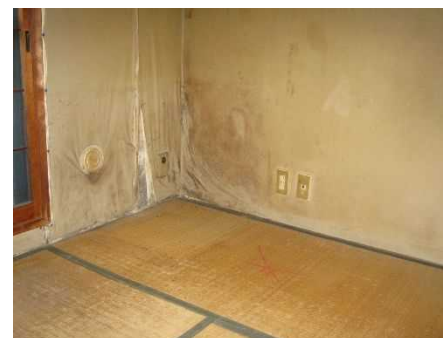
和室 畳下地交換 畳交換 壁クロス張り替え