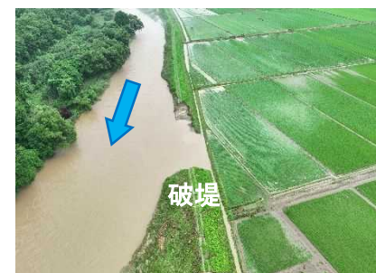
岩見川（秋田市河辺三内）