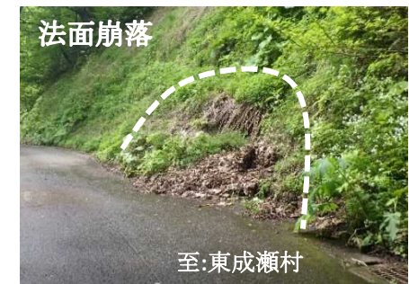
(主) 横手東成瀬線 山内三又地内(横手市)