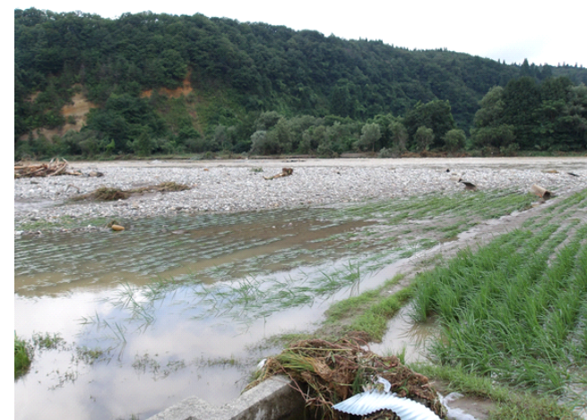
〔土砂流入 (秋田市河辺三内)〕