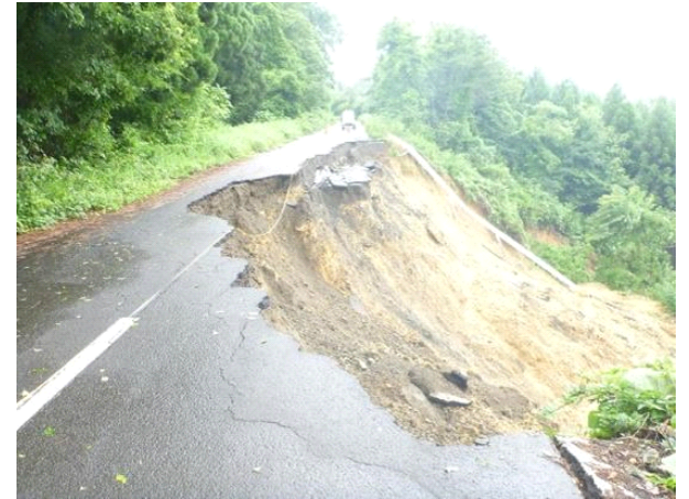
〔林道路体崩壊（能代市米代線）〕

1,837,200千円 国庫支出金 1,563,016千円 県債 252,100千円 一般財源 22,084千円