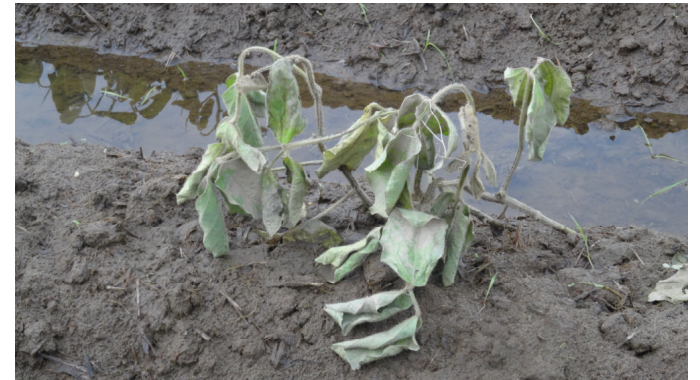
〔冠水した大豆（潟上市天王）〕

イ 補助率 1/3（施設・機械、水稻、大豆への支援） 1/2（園芸作物等、畜産、水産への支援）