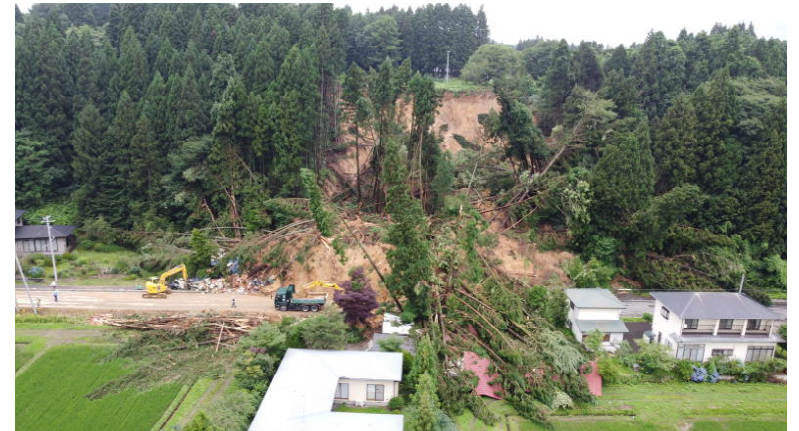
〔山腹崩壊（秋田市添川）〕