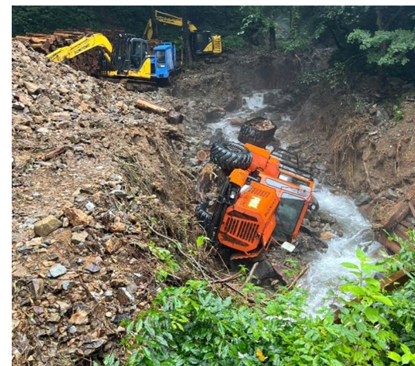
〔フォワーダの横転(秋田市仁別)〕