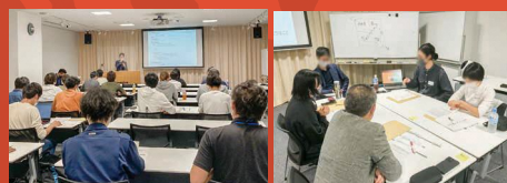
実践編の様子 県内各地域からエントリーがあり、座学やワークなどを通してプロジェクトの磨き上げを進めています。