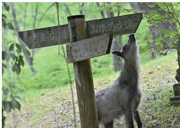
「真人山の山頂はこちらです」