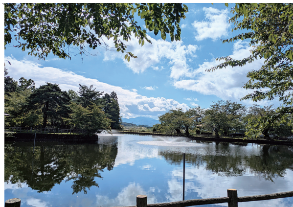
「里山で出逢う景色」