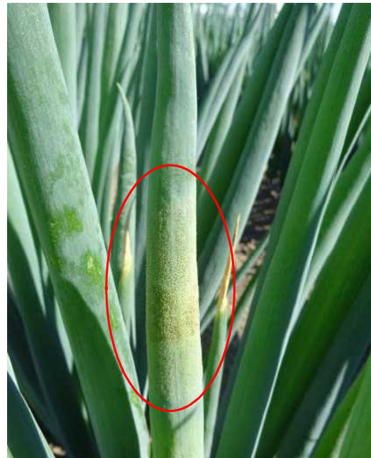
図-3 べと病の発病部位